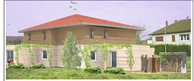
Perspective non contractuelle