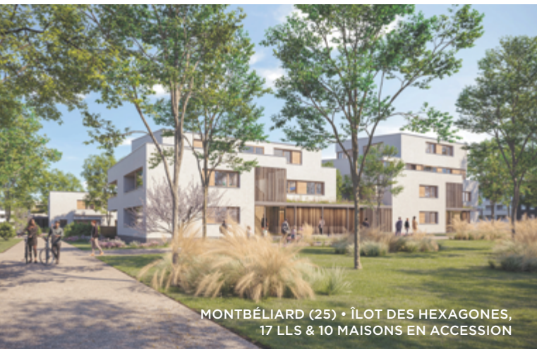
MONTBÉLIARD (25) • ÎLOT DES HEXAGONES, 17 LLS & 10 MAISONS EN ACCESSION