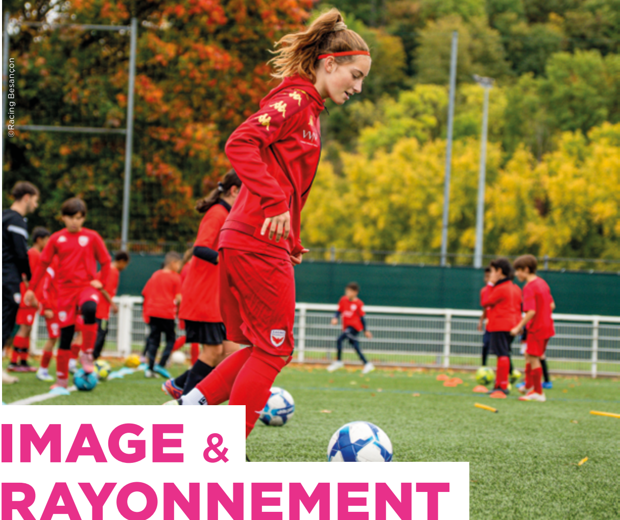
IMAGE & RAYONNEMENT