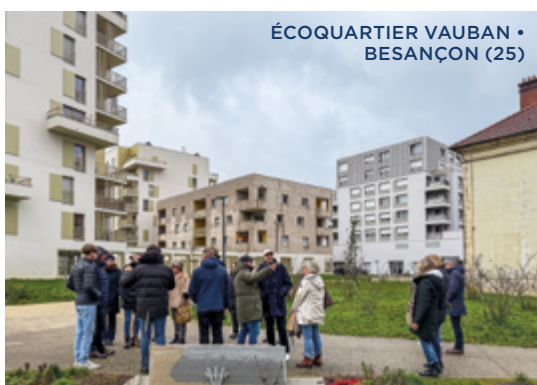
ÉCOQUARTIER VAUBAN • BESANÇON (25)

Le président, les administrateurs, la direction générale et le Codir prennent part à un programme de visites concocté par les équipes bisontines.