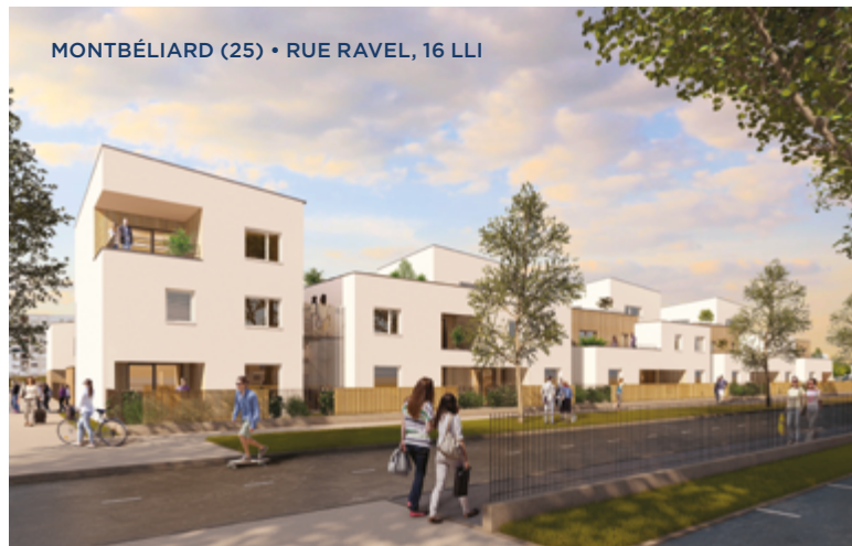
MONTBÉLIARD (25) • RUE RAVEL, 16 LLI