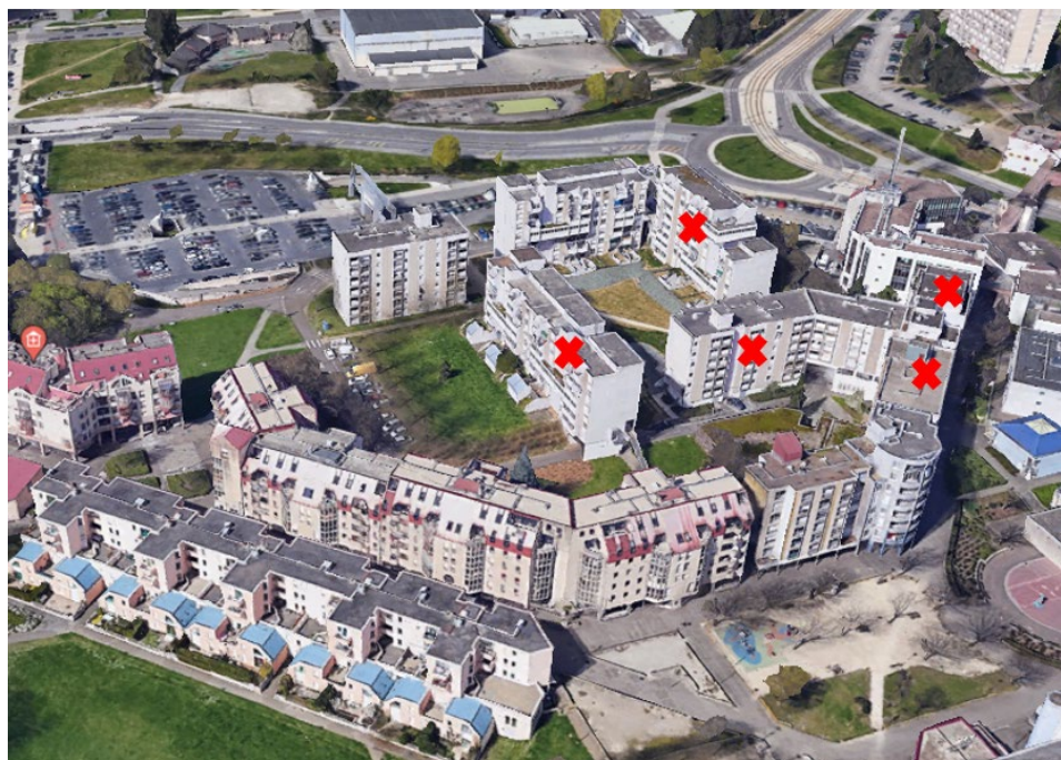
Secteur Cassin, ilot Van Gogh : les futures démolitions