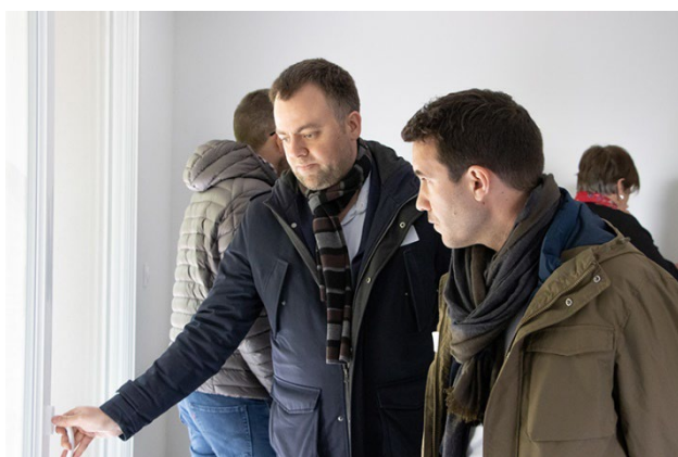
Visite d'un appartement